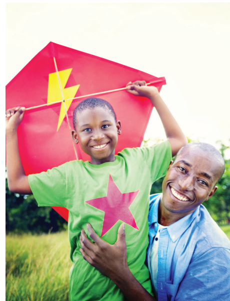
Las fotografías son únicamente para fines ilustrativos. Las personas que aparecen en ellas son modelos.

Para obtener más información llame a 929-252-5200